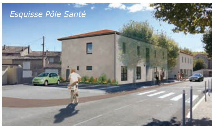
Esquisse Pôle Santé

Je termine en vous souhaitant à toutes et à tous une bonne et heureuse année 2018.